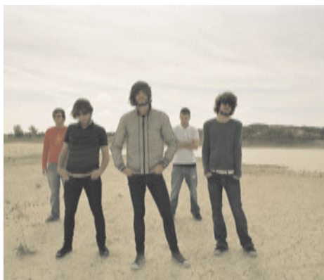
LAYABOUTS CÓMO HERMANAR ROCK Y SINTETIZADORES